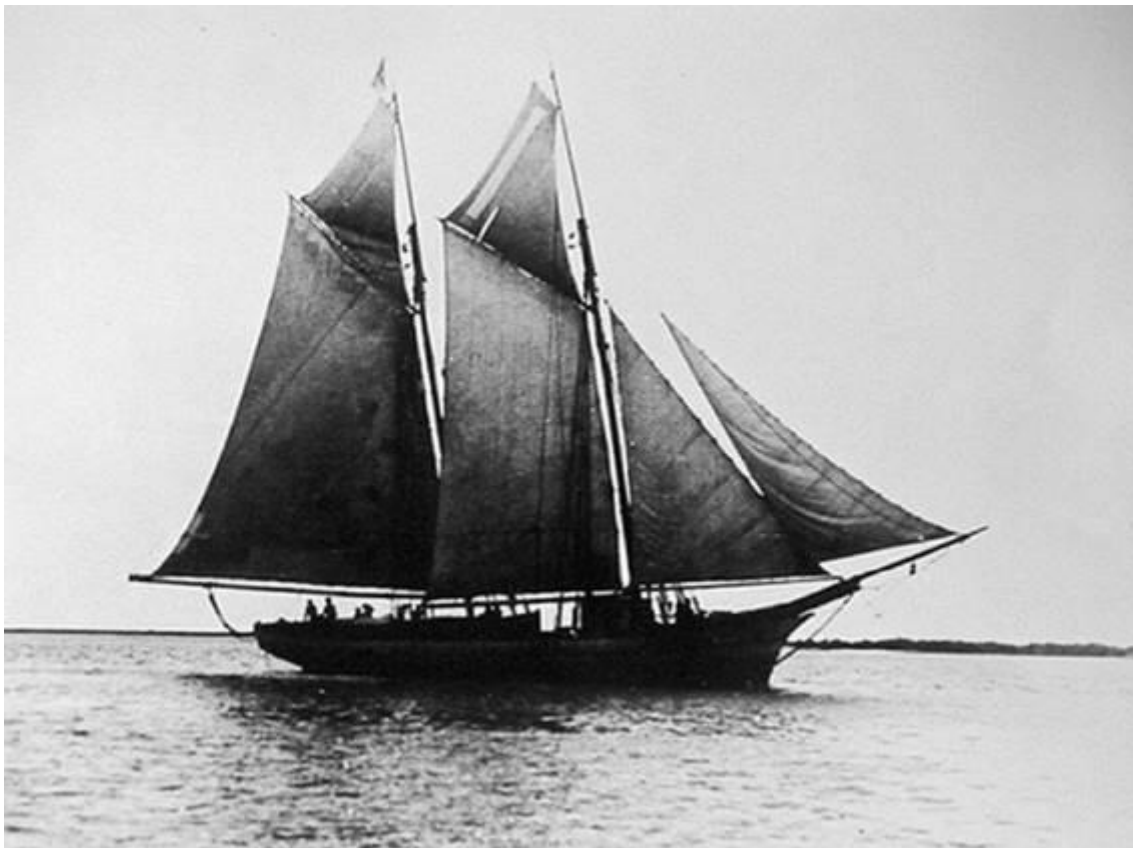
Figura 1: Típico late da Lagoa dos Patos. S/d.

Os lates eram embarcações com capacidade de carga entre 20 e 120 toneladas, de 40 e 60 pés de comprimento, armação e velame de escuna 1 . Sua carga compunha-se tipicamente dos gêneros diversos consumidos na região: charque, grãos, farinha, aguardente, móveis, couro e madeira. A tripulação era distribuída em: mestre (posteriormente com a introdução do motor passou a ser o motorista), marinheiro (poderia ser um ou mais dependendo da carga e da necessidade), moço de convés (aprendiz) e cozinheiro (Copstein, 1992: 81-87).