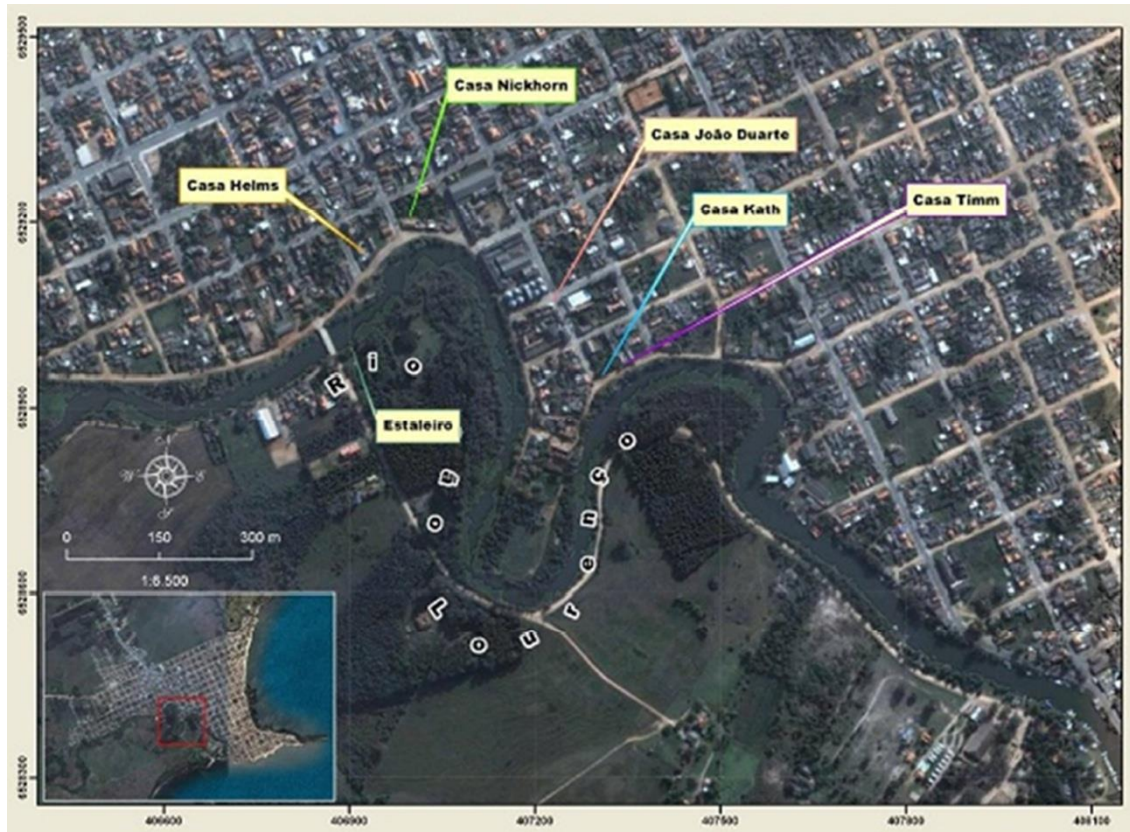
Mapa 2: Localização de algumas casas comerciais.

Todas as casas mencionadas possuíam seus próprios lates que permaneciam atracados em frente a seus prédios a fim de escoar o excedente de produtos comprados pelos comerciantes para serem revendidos na cidade de Rio Grande. Normalmente estas casas tinham sua própria tripulação e em casos esporádicos, de muita demanda, chegavam a fretar lates de outros proprietários. Os lates também faziam o caminho inverso e traziam mercadorias para serem revendidas na cidade. Os lates que navegavam no sistema de cabotagem também atracavam no porto de São Lourenço para realizarem negócios com os ribeirinhos.