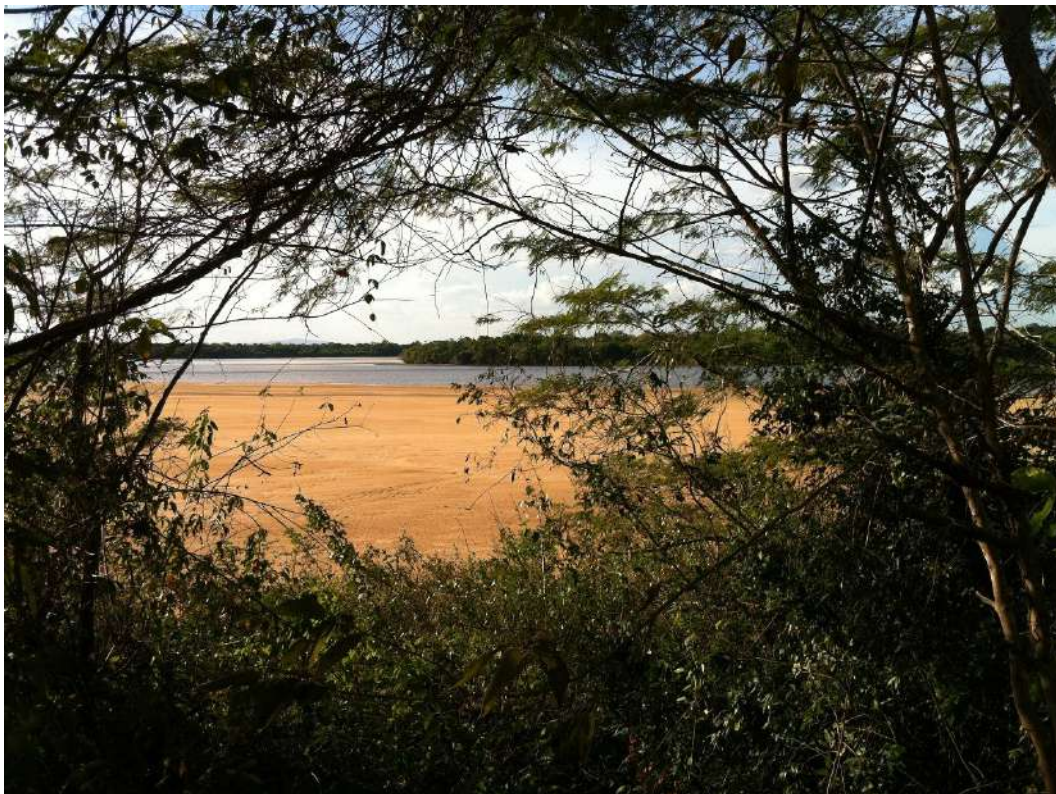
Figura 2: Confluência dos rios Tacutu e Uraricoera, formadores do Rio Branco. Vista de sua praia, a partir da Forte de São Joaquim.

Com uma planta simples, a sua estrutura foi levantada em pedras, material existente nas formações locais; como cimentante teria sido utilizado o barro, 10 também existente na área. Suas dependências comportavam apenas o efetivo de um pouco mais de uma dúzia de combatentes. É provável que do lado externo existissem algumas estruturas destinadas a apoio, inclusive para indígenas aliados 11 , prática recorrente em muitos fortes, que mantinham indígenas aliados no entorno do forte, desempenhando diferentes funções. Segundo Castro, (2011), uma pesquisa arqueológica realizada na área, constatou no entorno do Forte São Joaquim, a presença de ‘vilas indígenas’ 12 (Figura 4).