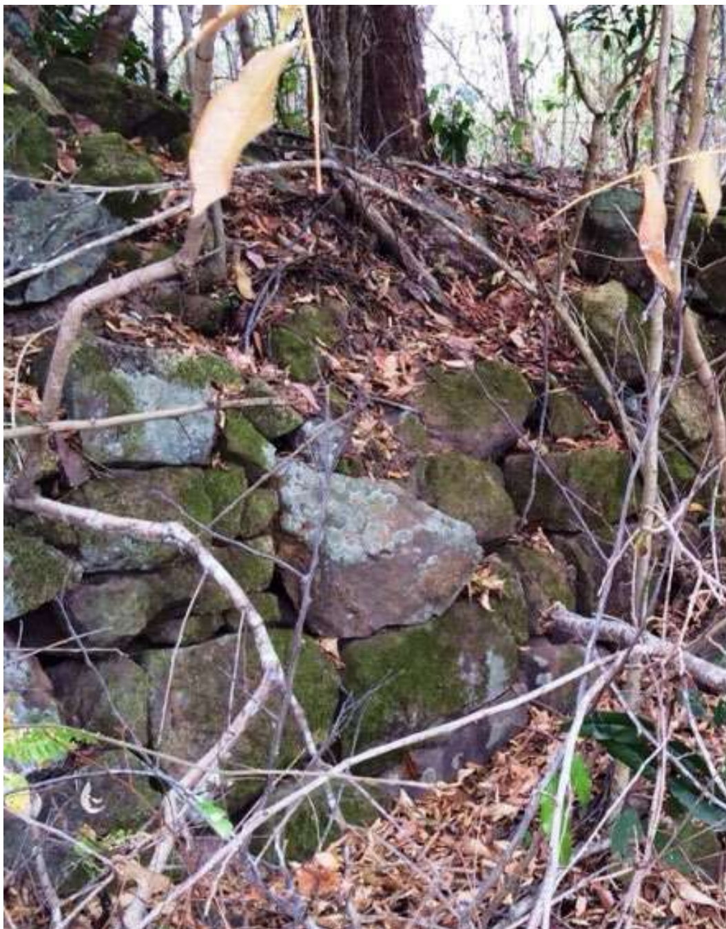
Figura 3: Detalhe de um trecho de parede remanescente, que mostra uma construção não argamassada, em 'junta seca'. Acervo Arqueolog Pesquisas, 2012.

Naquele local afastado de outras povoações, a provisão de víveres, de armamento e munição tornava-se um problema iminente (Figura 5). O suprimento da “munição de boca”, muitas vezes exigia que soldados se dedicassem à caça e mesmo ao plantio de mandioca, batatas, milho, e outros cultivos de retorno rápido, solução comumente adotadas em diferentes fortificações, maiores e menores. Neste mister, o apoio indígena no entorno dos fortes tornou-se fundamental. Em diferentes ocasiões essa proximidade, e sobretudo a falta de cumprimento de