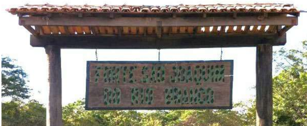
Figura 11: Placa indicativa, com o nome do Forte, no portão de entrada da área do Forte.

Em 1998 as ruínas do Forte foram inscritas no Cadastro Nacional de Sítios Arqueológicos do Iphan, instrumento de proteção criado em atendimento à Lei nº 3.924, de 1961. Em 2001 o Forte São Joaquim foi tombado pelo Governo do Estado de Roraima como um sítio histórico, o qual ocupa uma área total de 25.738,47 metros quadrados. E, em 11 de setembro de 2014, foi tombado pelo Iphan, sendo inscrito nos livros do Tombo Histórico e Livro do Tombo Arqueológico, Etnográfico e Paisagístico (Rosa e Thompson, 2019, p. 65).