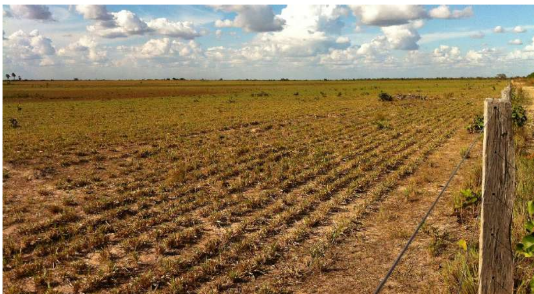
Figura 10: Fazenda de gado (propriedade privada) nas proximidades do Forte. Acervo Arqueolog Pesquisas, 2012.

As ruínas do Forte se encontram no interior de uma propriedade privada, e seu acesso é possível através de contato com o 7º Batalhão de Infantaria de Selva (C Fron. RORAIMA/7º BIS), que assumiu a guarda das chaves da área cercada. Tais medidas se mostram necessárias, vez que o terreno é ainda uma área erma, estando sujeita a eventuais ações destrutivas (Figura 11).