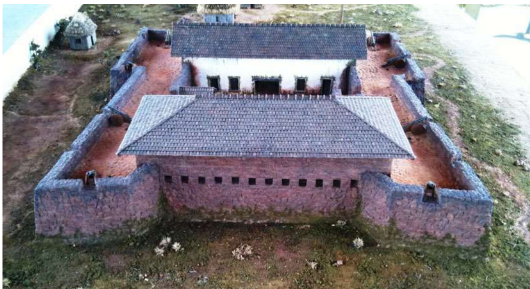
Figura 8: Uma das maquetes do Forte de São Joaquim, representando sua primeira feição.

Existe, entretanto, uma Unidade do Exército Brasileiro, o 7º Batalhão de Infantaria de Selva (C Fron RORAIMA/7º BIS), cuja denominação histórica é “Batalhão do Forte São Joaquim”. Naquela Unidade Militar reverencia-se o nome do Forte e se busca educar seu efetivo com relação a história local; a unidade possui ainda várias maquetes desse Forte em suas dependências (Figura 9).