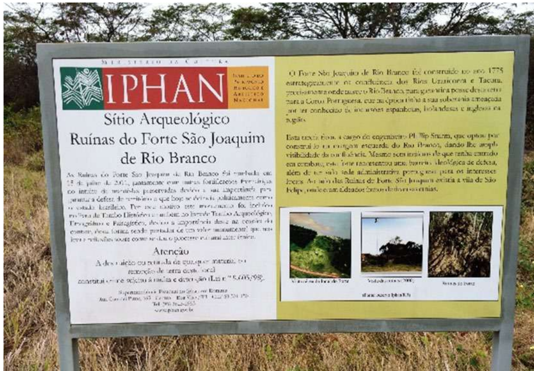
Figura 7: Placa informativa, assentada pelo Iphan.

Existe, entretanto, uma Unidade do Exército Brasileiro, o 7º Batalhão de Infantaria de Selva (C Fron RORAIMA/7º BIS), cuja denominação histórica é “Batalhão do Forte São Joaquim”. Naquela Unidade Militar reverencia-se o nome do Forte e se busca educar seu efetivo com relação a história local; a unidade possui ainda várias maquetes desse Forte em suas dependências (Figura 9).