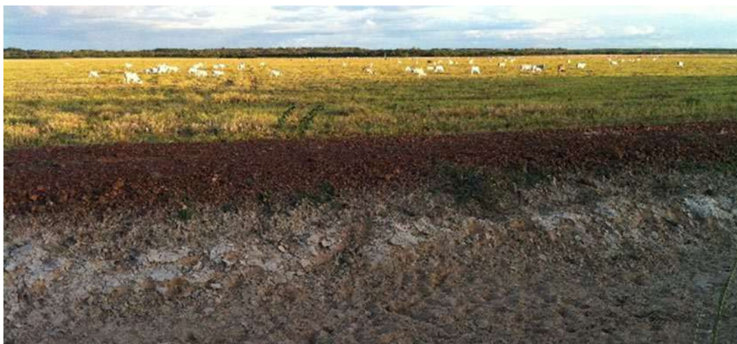
Figura 4: Aspecto da topografia no entorno do Forte. Acervo Arqueolog Pesquisas, 2012.

No caso do Forte de São Joaquim do Rio Branco, a questão do suprimento alimentar foi contornada com a implantação de fazendas, em seu entorno. Assim, com o estímulo do próprio Lobo D'Almada, foram implantadas pelo menos três fazendas naquelas cercanias: a São Bento, a São José e a São Marcos, essa última, ainda hoje em atividade, é administrada por um grupo indígena. Tais fazendas, à época, supririam de alimento a tropa do Forte (Figura 6).