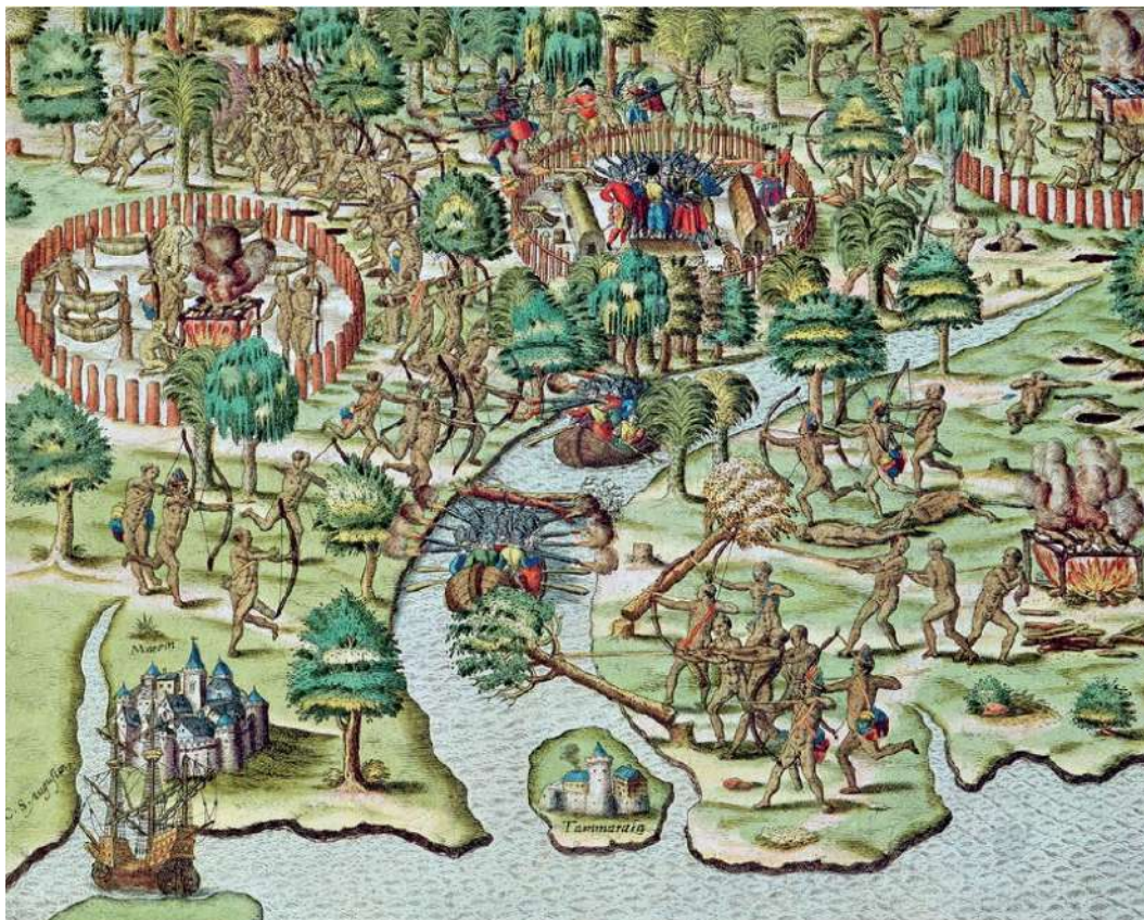
Figura 1: Cerco a Igarassu. Gravura de Theodor de Bry.

O desenvolvimento da produção e comércio do açúcar, que estimulou a criação de vilas, de novos engenhos, despertou ainda mais o interesse de outros povos europeus por aquelas terras. Um sistema defensivo foi intensificado para garantir não apenas os portos, como as demais áreas ocupadas pelos portugueses. Como resposta, foi intensificado o sistema de defesa com a construção de fortes e redutos. Fato é, que não impediu a chegada de outros europeus, alguns dos quais, como os holandeses 3 que ocuparam parte do território brasileiro por vinte e quatro anos, quando ocorreram violentas batalhas, conflitos e embates menores.