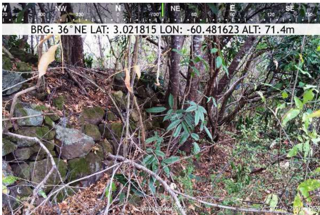
Figura 6: Em meio à mata que se regenera, algumas pedras alinhadas ainda demarcam o alicerce das paredes do forte; pequenos trechos das muralhas do forte ainda permanecem visíveis; pedras dispersas refletem a pilhagem de que foi vítima o antigo Forte.

O comandante Sturm veio a falecer em 1778 e foi sepultado do lado externo do forte que construiu. Cerca de 40 anos após sua morte, restava no Forte apenas meia dúzia de soldados. Pouco depois o Forte foi abandonado; parte das pedras de sua alvenaria foi sendo reutilizada por moradores locais, e esse baluarte da fixação lusitana foi não apenas abandonado, mas sobretudo esquecido.