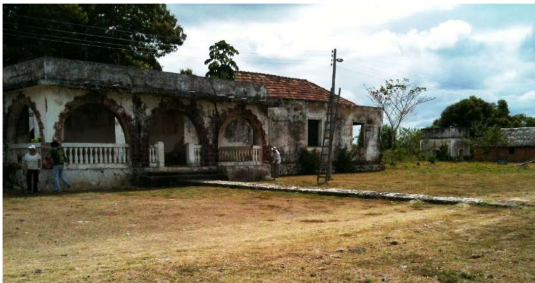
Figura 5: Antiga casa que serviu à administradores da Fazenda São Marcos. Acervo Arqueolog Pesquisas, 2012.