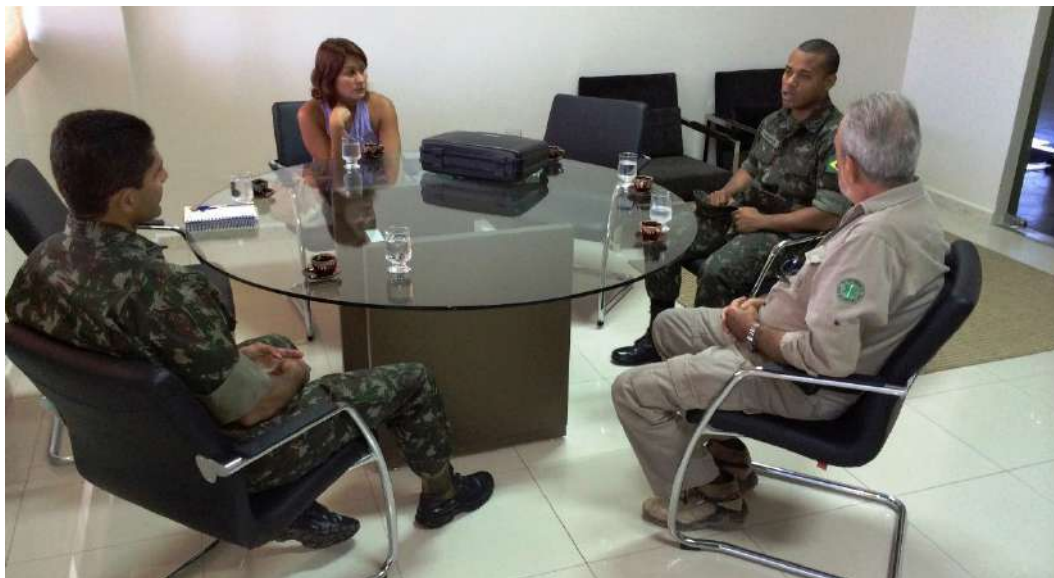
Figura 9: Reunião com a Superintendente do Iphan/RR e o comando do 7º BIS.

Por ocasião de nossa visita ao local do Forte, a OM nos recebeu de forma muito solícita, colocando à nossa disposição um ônibus e alguns militares para nos acompanhar, juntamente com uma equipe da Superintendência do Iphan em Roraima (Figura 10).